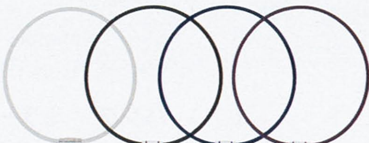
オフホワイト ブラック ネイビー プラム